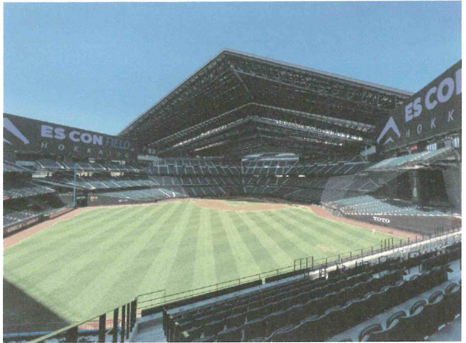
【座席は、内野席の3階になります】