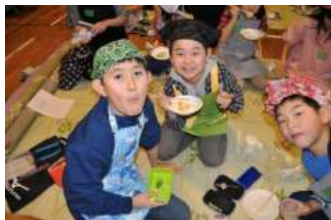
子供たちの笑顔に、前日から準備に励んだスタッフさんたちも報われます☆