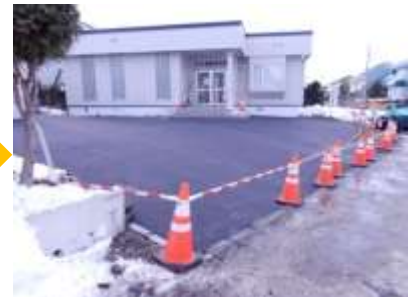
段差があり、表面がデコボコ(>_<)