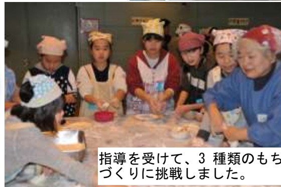
指導を受けて、3種類のもちづくりに挑戦しました。